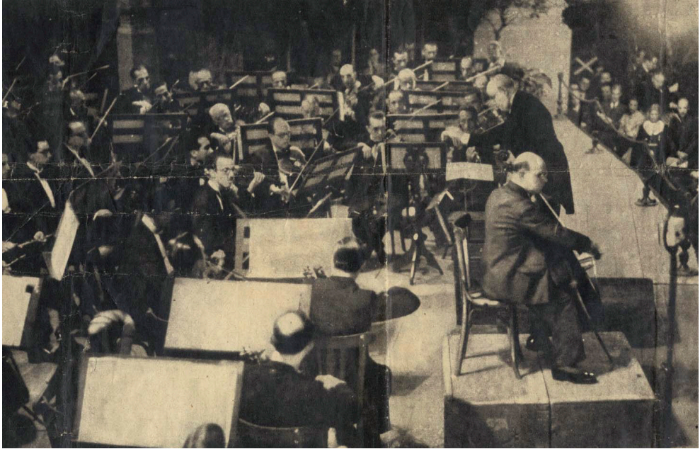
Figura 9. Pau Casals tocant en un concert en benefici als infants víctimes de la guerra al Gran Teatre del Liceu, el 19 d'octubre de 1938, l'últim concert fet a Catalunya abans de marxar a l'exili.

i del poble. Les seves paraules publicades a la revista Saturday Law Review el 1953 a l'article titulat «I have not changed my mind» són prou significatives i compromeses: