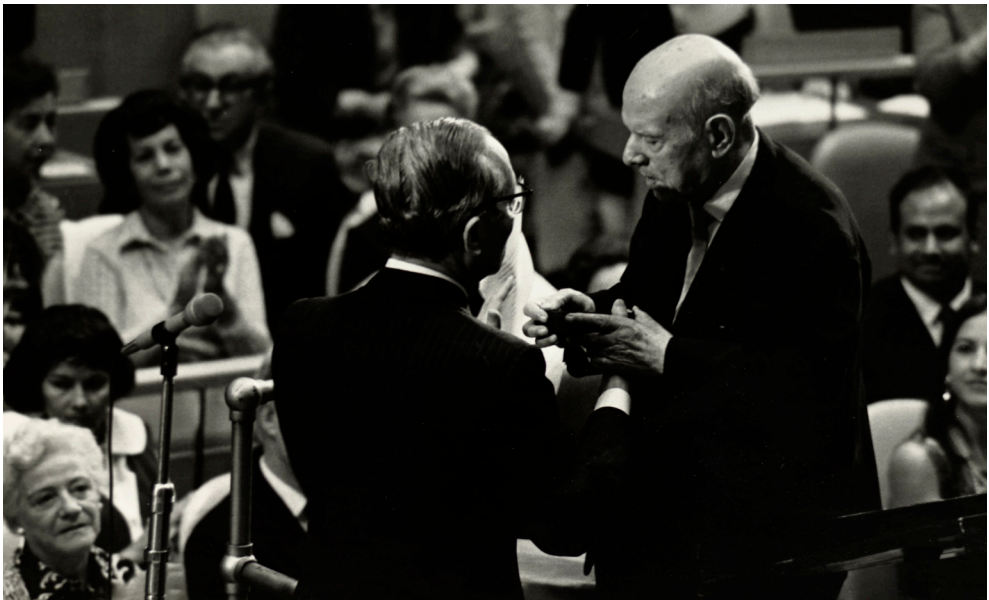
Figura 14. U Thant, secretari general de les Nacions Unides, fa entrega a Pau Casals la Medalla de la Pau de les Nacions Unides, després del concert a la seu de l'ONU a Nova York, 24 d'octubre de 1971. Fons Pau Casals, ANC1-367-N-2567.