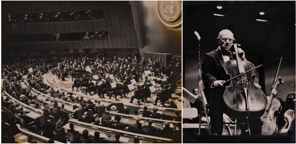
Figura 10. Pau Casals tocant amb la Boston Symphony Orchestra durant el concert del Dia de les Nacions Unides a la seu de l'ONU, a Nova York, 24 d'octubre de 1958. FPC/ANC. Fons Pau Casals, ANC1-367-N-4665 i 4668.

ça, destacant així la capacitat de l'art per actuar com un vehicle de transformació social. Fou a Canes on va tocar aquesta peça per primera vegada, tal com comenta Joan Alavedra: