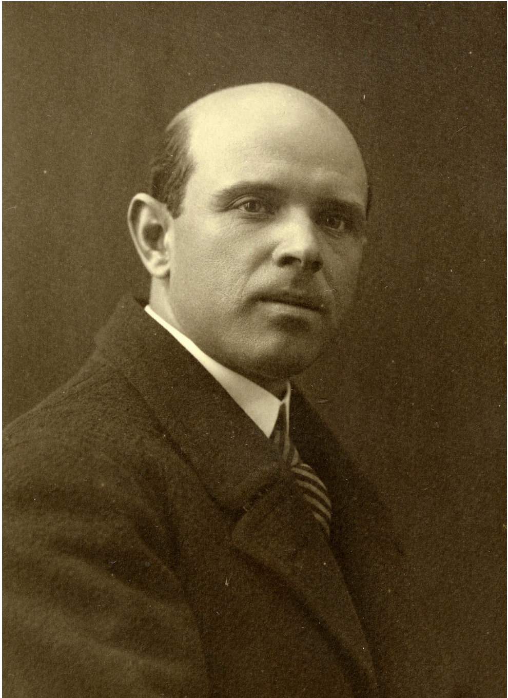
Figura 1. Pau Casals a Bucarest, c. 1928-1930.