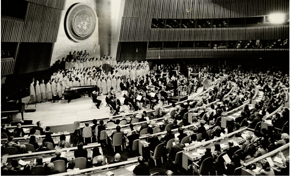
Figura 13. Pau Casals dirigint l'Orquesta del Festival Casals de Puerto Rico, el Chorus of The Manhattan School of Music i The United Nations Singers en l'estrena de la seva obra l'Himne a les Nacions Unides durant el concert del Dia de les Nacions Unides a la seu de l'ONU a Nova York, 24 d'octubre de 1971. FPC/ANC. Fons Pau Casals, ANC1-367-N-2561.