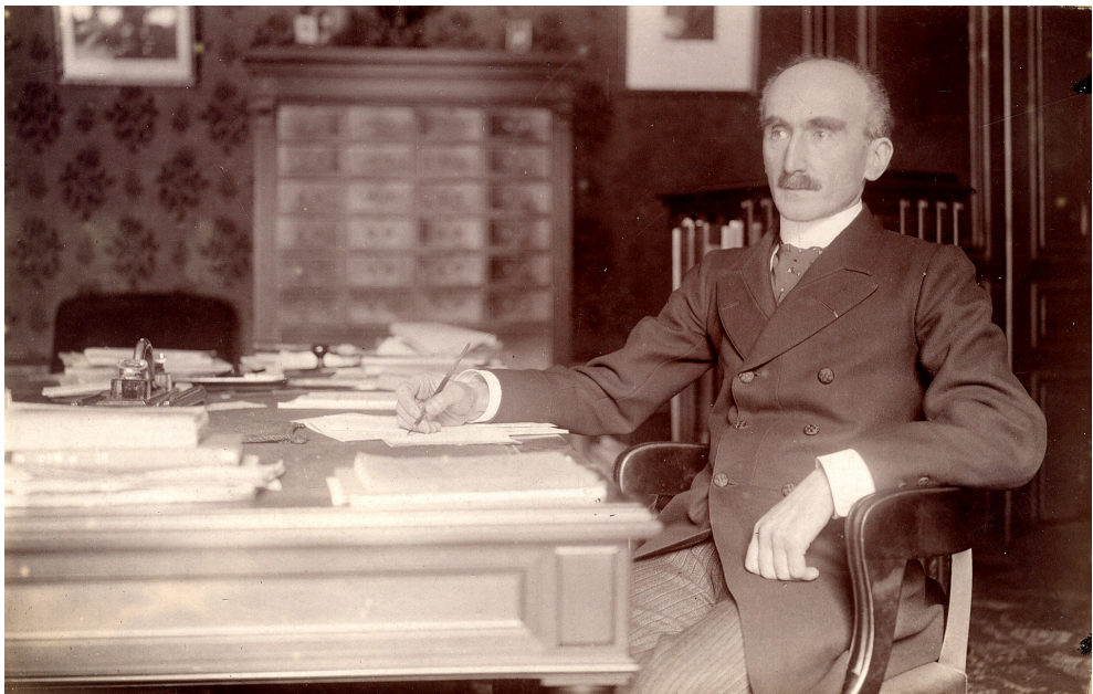
Figura 5. Henri Bergson al seu despatx. Dornac, 1908. Casa-Museo Unamuno de la Universidad de Salamanca, AUSA_CMU,92/486.

La noció de temps en Henri Bergson és central en la seva filosofia i es desenvolupa especialment en la seva obra Essai sur les données immédiates de la conscience ( Assaig sobre les dades immediates de la consciència , 1889), Matière et Mémoire (' Matèria i memòria ', 1896) i L'Évolution créatrice (' L'evolució creadora ', 1907). En la seva teoria, Bergson distingeix entre dos tipus de temps: el temps que es mesura per l'horari (temps quantitatiu) i la durada (temps qualita-