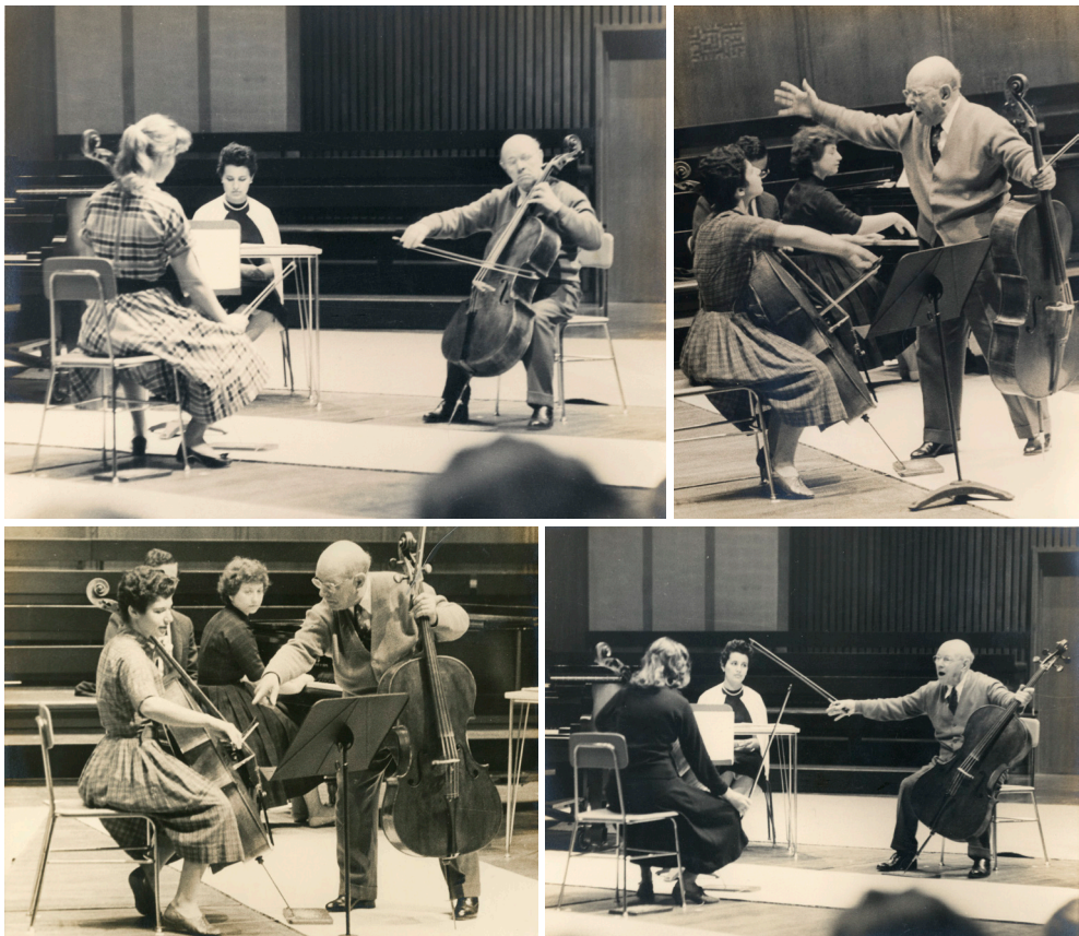
Figura 12. Pau Casals impartint classe a diverses violoncel·listes durant les masterclass a la Universitat de Califòrnia, a Berkeley, 1960. FPC/ANC. Fons Pau Casals, ANC1-367-N-4611; 4605; 4606 i 4610.

La música no podia ser separada ni de la corporalitat, ni de l'espai; el violoncel era una extensió del seu propi cos, una eina per donar forma al que sentia i volia expressar en un espai determinat. D'aquí la importància que dona a la postura, on el moviment corporal es convertia en part integrant del procés interpretatiu. La relació entre el cos i la música com una fusió inextricable: l'intèrpret no era un agent passiu, sinó que el seu cos creava juntament amb la seva voluntat i intuïció.