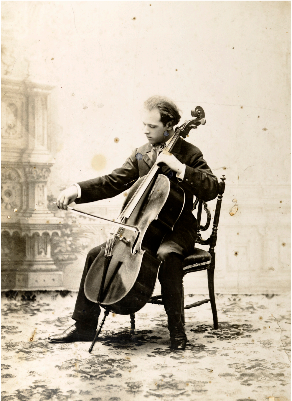
Figura 3. Pau Casals tocant el violoncel amb vint-i-tres anys, a l'època del seu debut a París.