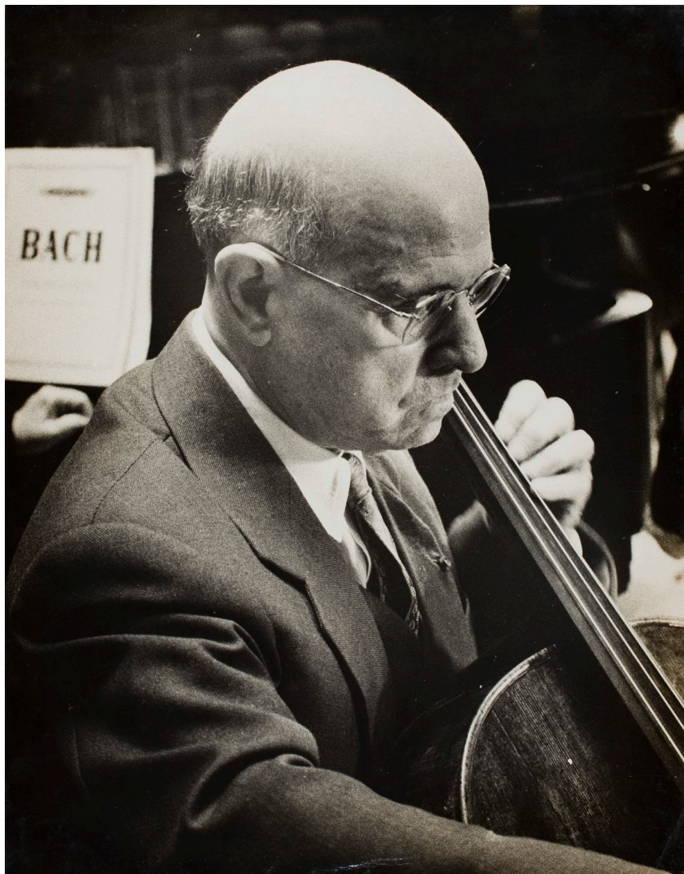
Figura 7. Pau Casals tocant el violoncel durant el concert del Dia de les Nacions Unides a la seu de l'ONU, a Nova York. F.B. Grunzweig, 24 d'octubre de 1958. FPC/ANC. Fons Pau Casals, ANC1-367-N-5556.