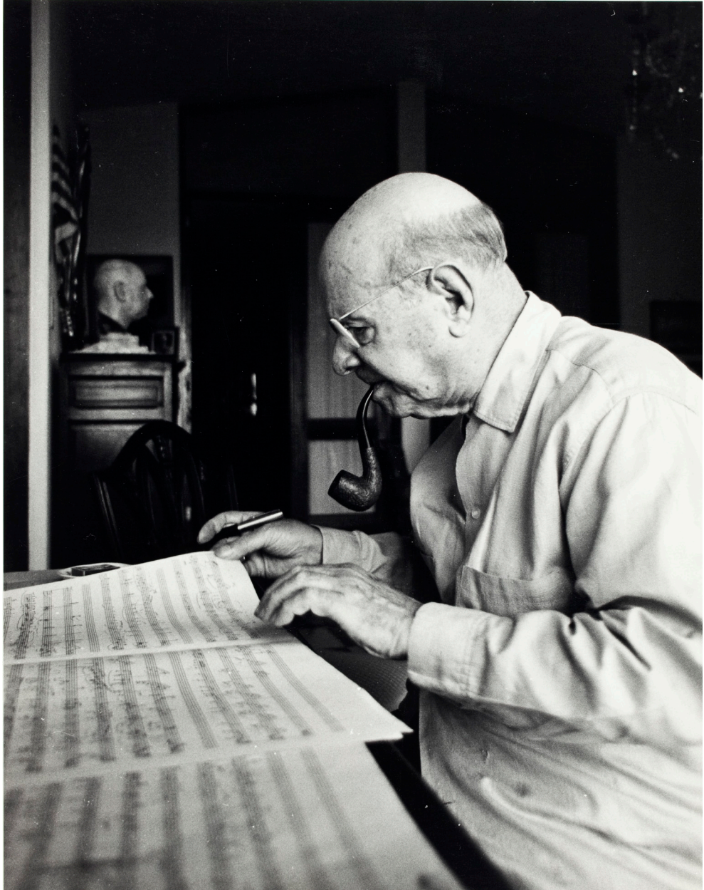
Figura 6. Pau Casals estudiant unes partitures, 1965. FPC/ANC. Fons Pau Casals, ANC1-367-N-7564.