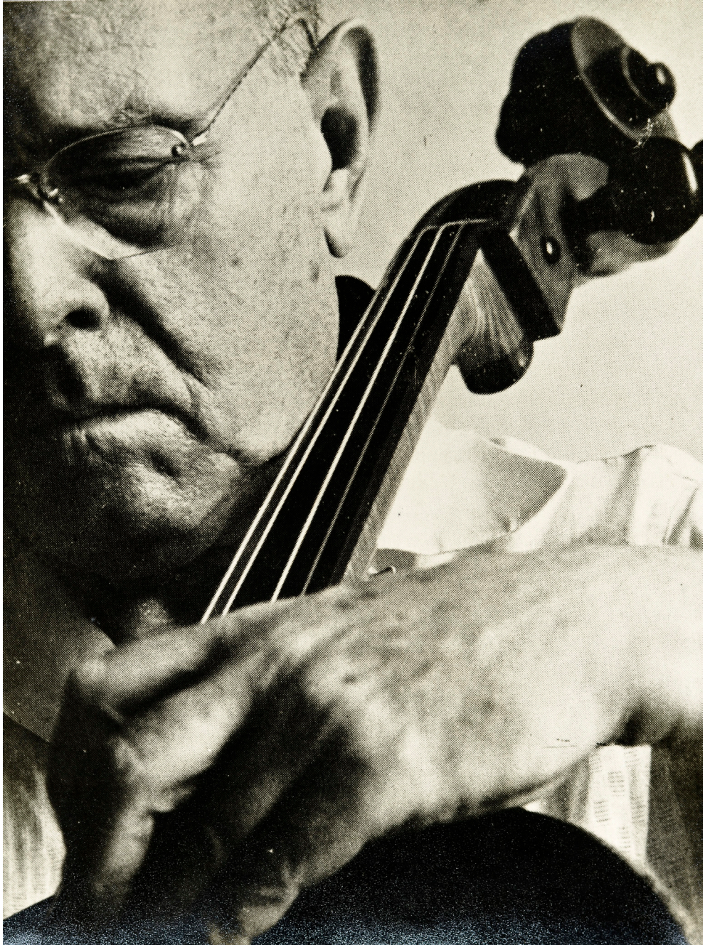
Figura 8. Pau Casals tocant el violoncel, a Prada.