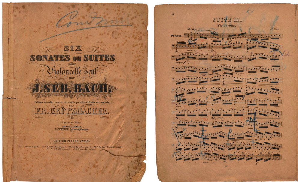
Figura 11. Partitura de les Suites per a violoncel sol de Johann Sebastian Bach que Pau Casals va comprar amb el seu pare quan tenia 13 anys.

Per al músic, les Suites de Bach exigien ser enteses des d'una pregonesa que va més enllà de la simple lectura tècnica de la partitura. En lloc de veure-les com una mera execució de les notes escrites, Casals hi introduïa la seva pròpia sensibilitat interpretativa, creava una relació activa amb l'obra que transcendia la seva simple reproducció. En aquest sentit, se situava com un intermediari entre la música escrita per Bach i l'audiència, era un intèrpret que transformava les notes en un discurs expressiu, poètic i filosòfic. I això era així perquè el violoncellista entenia la interpretació com un diàleg viu amb l'obra, on cada compàs era una relectura personal, influïda per les circumstàncies i l'experiència individual. En relació amb les Suites , no es limitava a la partitura com a guia rígida; més aviat veia l'obra com