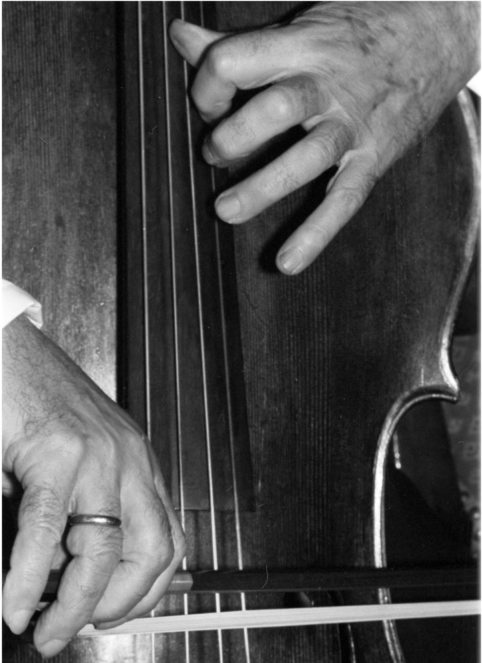
Figura 15. Detall de les mans de Pau Casals tocant el violoncel. Col·lecció Pau Casals i Defilló.