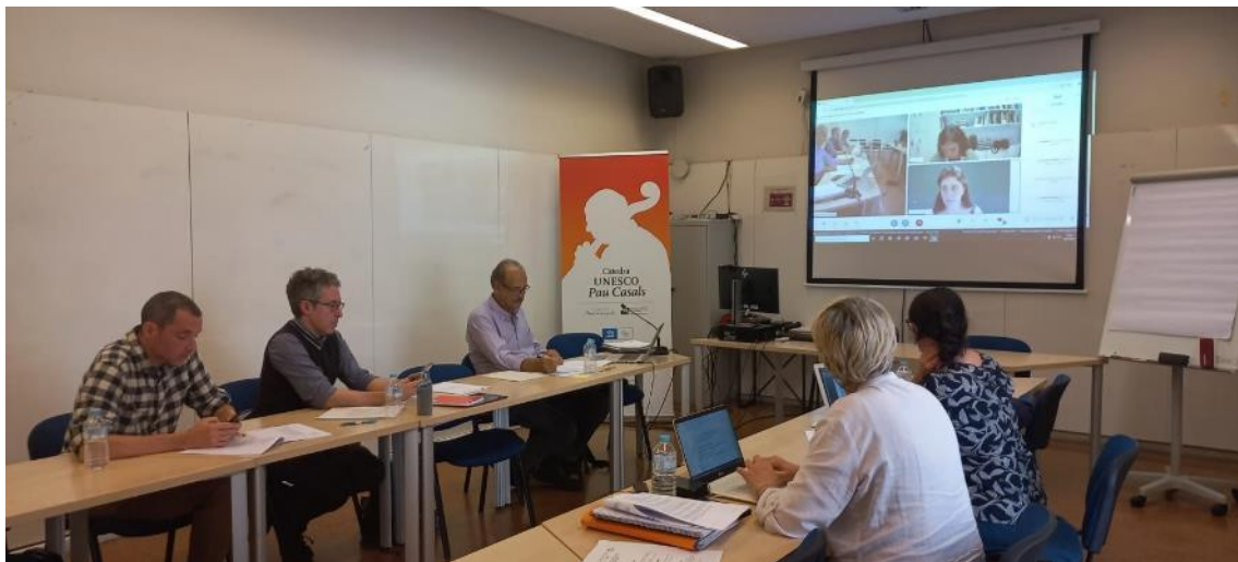
Reunión de expertos

28 de mayo. Reunión online de expertos del proyecto Educar por la paz desde los derechos culturales. Con el apoyo del ICIP.